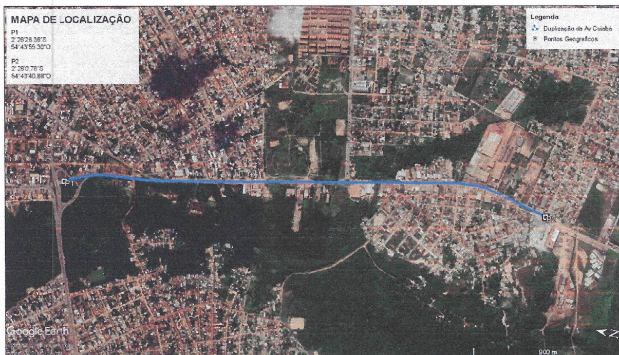
Figura 1 - Mapa de Localização – Av. Cuiabá