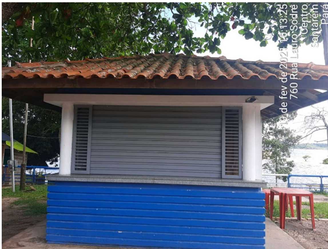
IMAGEM 01: Fachada principal do quiosque vistoriado