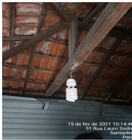
VISTA INTERNA TELHADO E PORTA ROLO