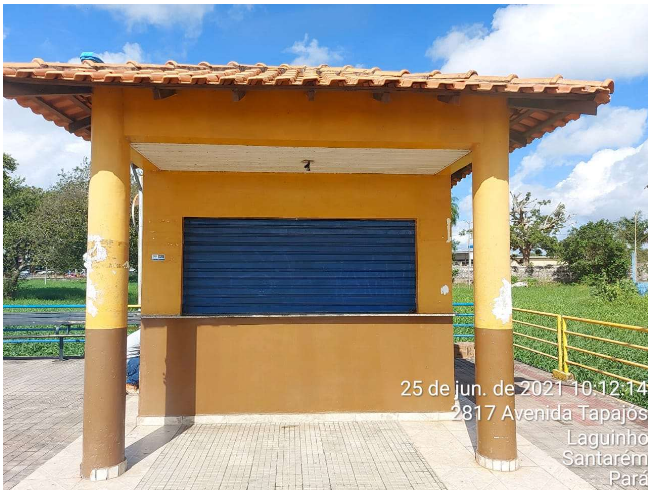
IMAGEM 01: Fachada principal do imóvel vistoriado