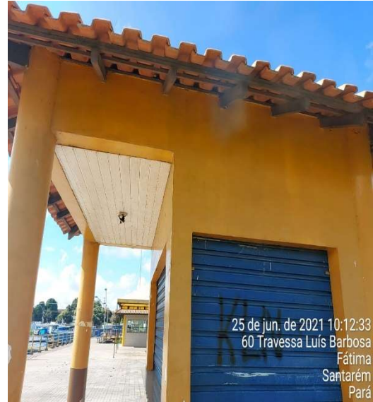
TELHADO E FACHADA