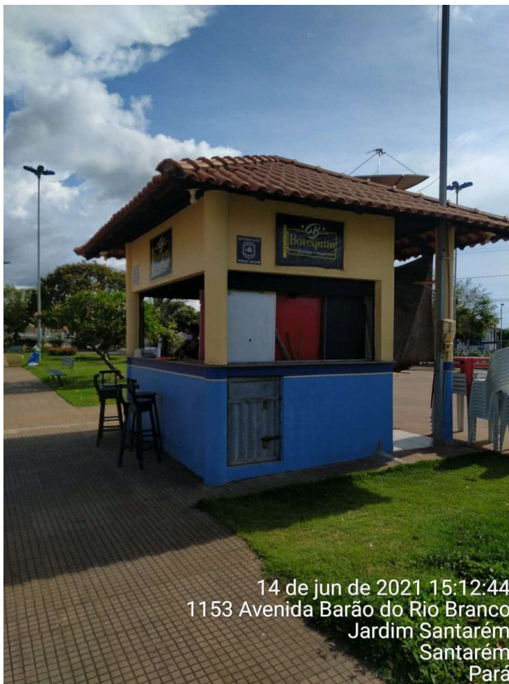
IMAGEM 01: Fachada principal do imóvel vistoriado