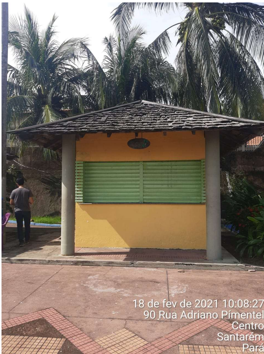
IMAGEM 01: Fachada principal do imóvel vistoriado

ENDEREÇO: Praça Fortaleza do Tapajós (Mirante)