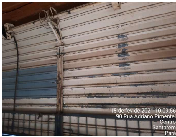
PORTA DE ROLO