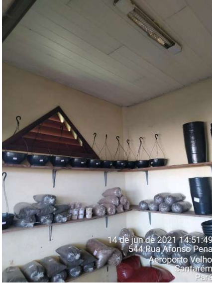
INTERNA E BALANCIM