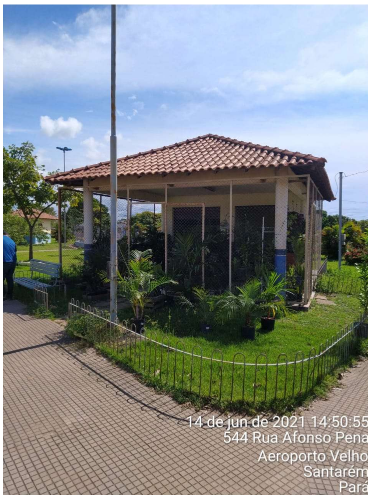
IMAGEM 01: Fachada principal do imóvel vistoriado