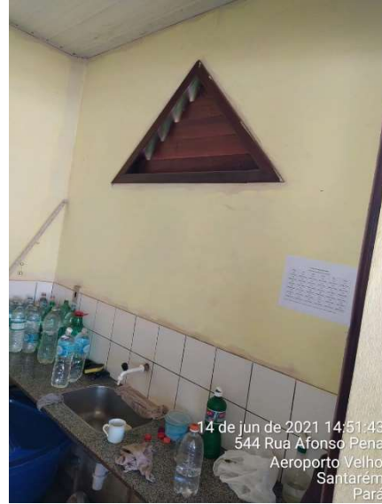
PIA E BALANCIM