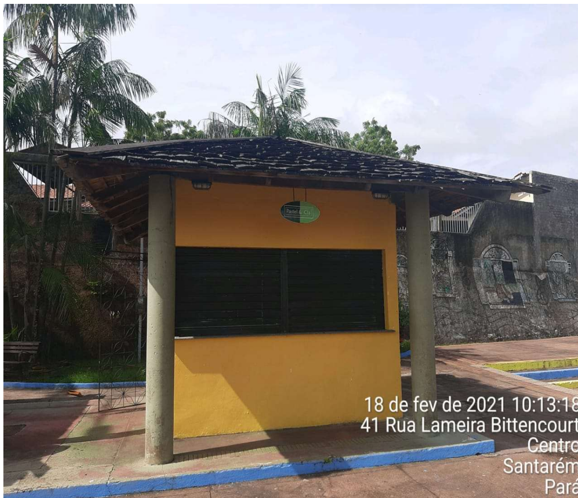
IMAGEM 01: Fachada principal do imóvel vistoriado

ENDEREÇO: Praça Fortaleza do Tapajós (Mirante)