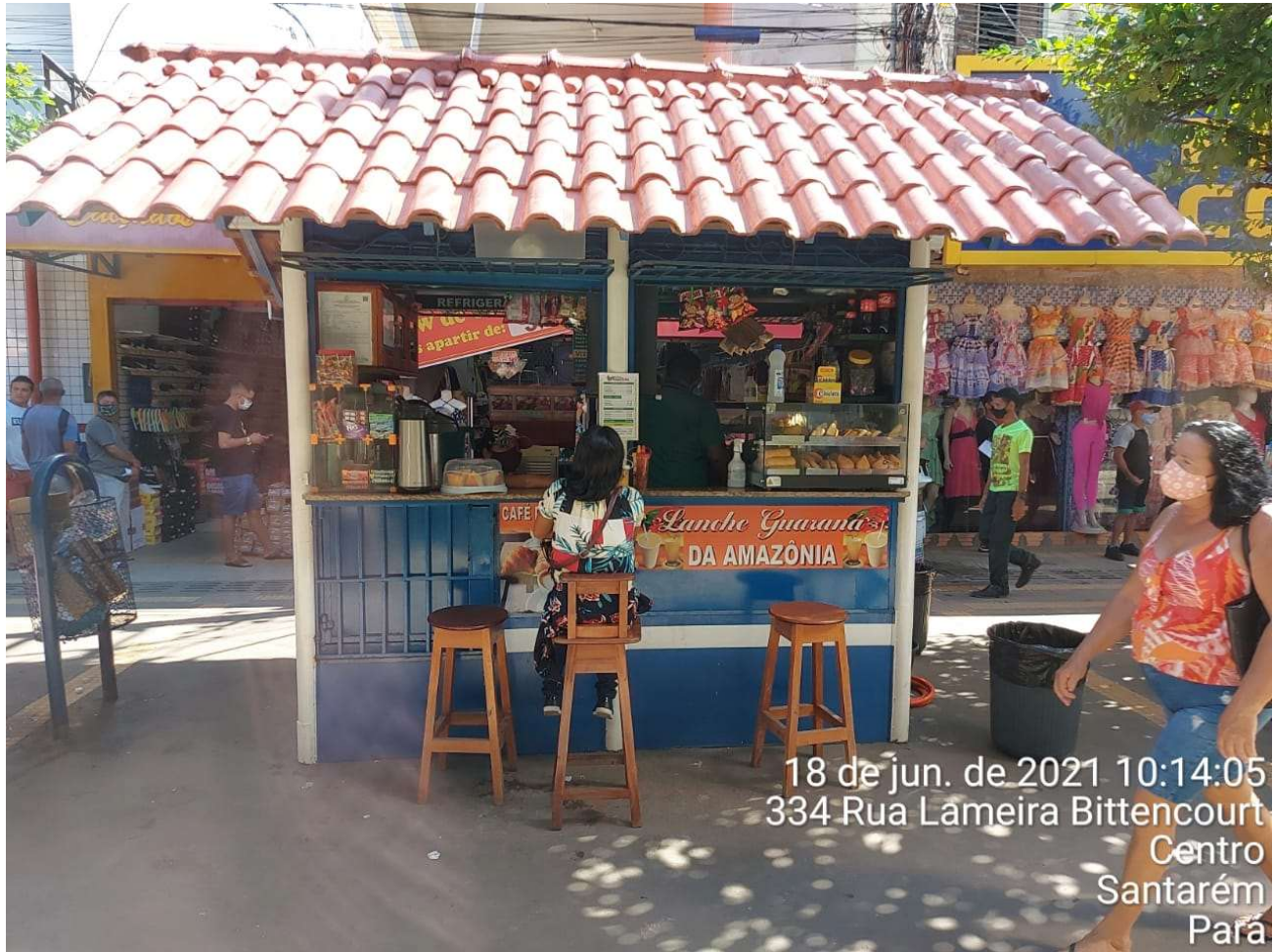
IMAGEM 01: Fachada principal do imóvel vistoriado