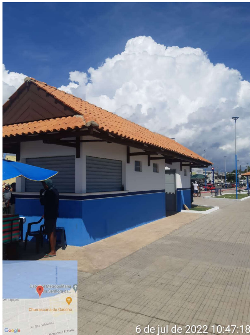
IMAGEM 01: Fachada do imóvel vistoriado