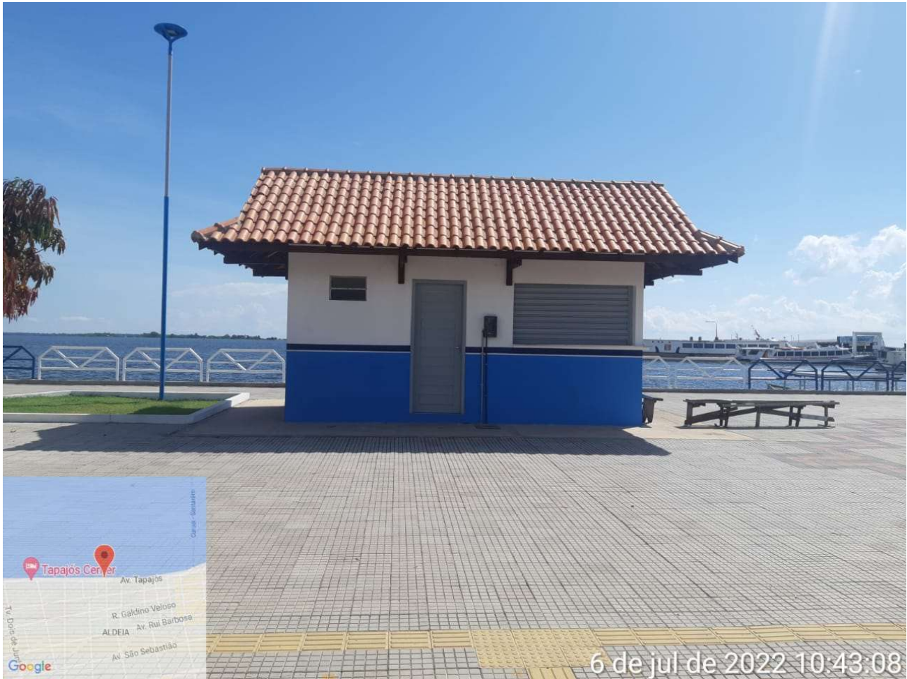
IMAGEM 01: Fachada principal do imóvel vistoriado