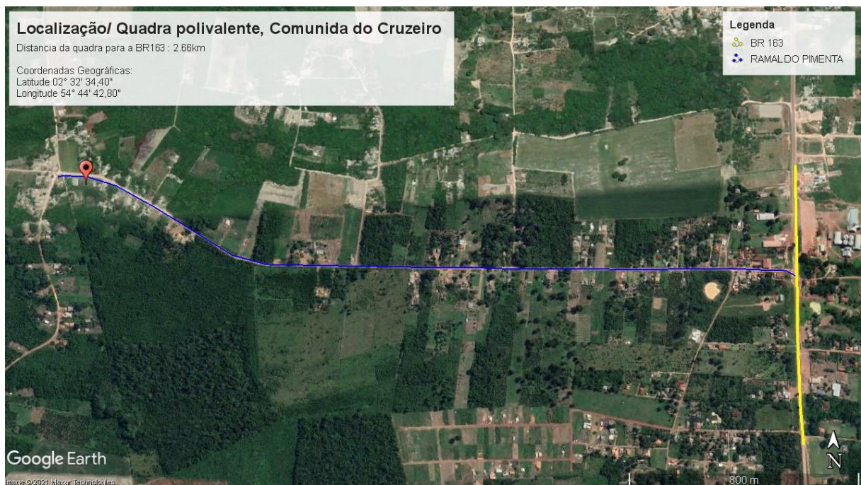
Mapa 3

O presente memorial descritivo com as especificações técnicas refere-se aos serviços de engenharia para a construção de uma quadra poliesportiva na comunidade do Cruzeiro em Santarém – PA, identificada no mapa abaixo, contendo suas coordenadas geográficas e extensão para acesso a partir da BR163, tendo as especificações adiante descritas. Com uma área total aproximada de 1.200m 2 , com medidas aproximadas de 40,00m x 30,00m.