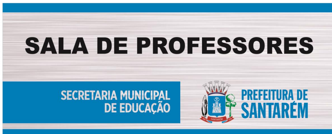
IMAGEM 04: MODELO DE PLACA DE IDENTIFICAÇÃO (30X10 cm)