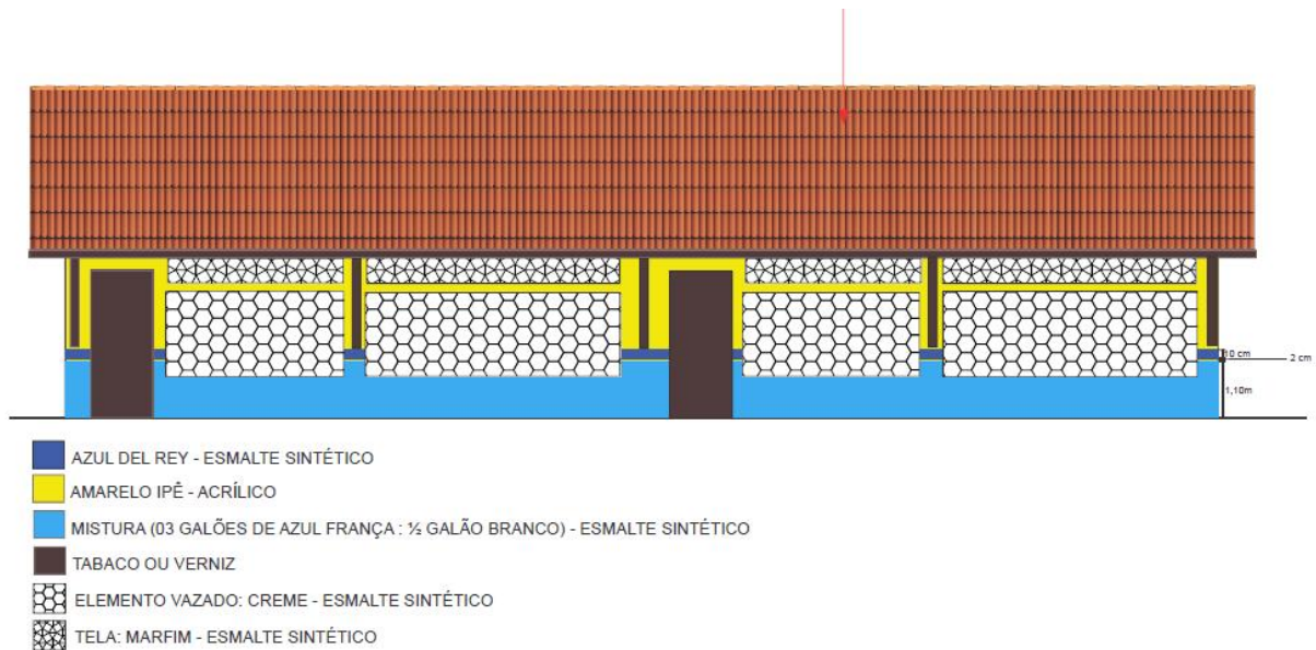
IMAGEM 01: PINTURA EXTERNA

Av. Dr. Anysio Chaves nº 712 – Aeroporto Velho- CEP 68030-360 - Santarém/PA E-mail: 3522-7735semed@santarem.pa.gov.br Fone (93) 3522-7735