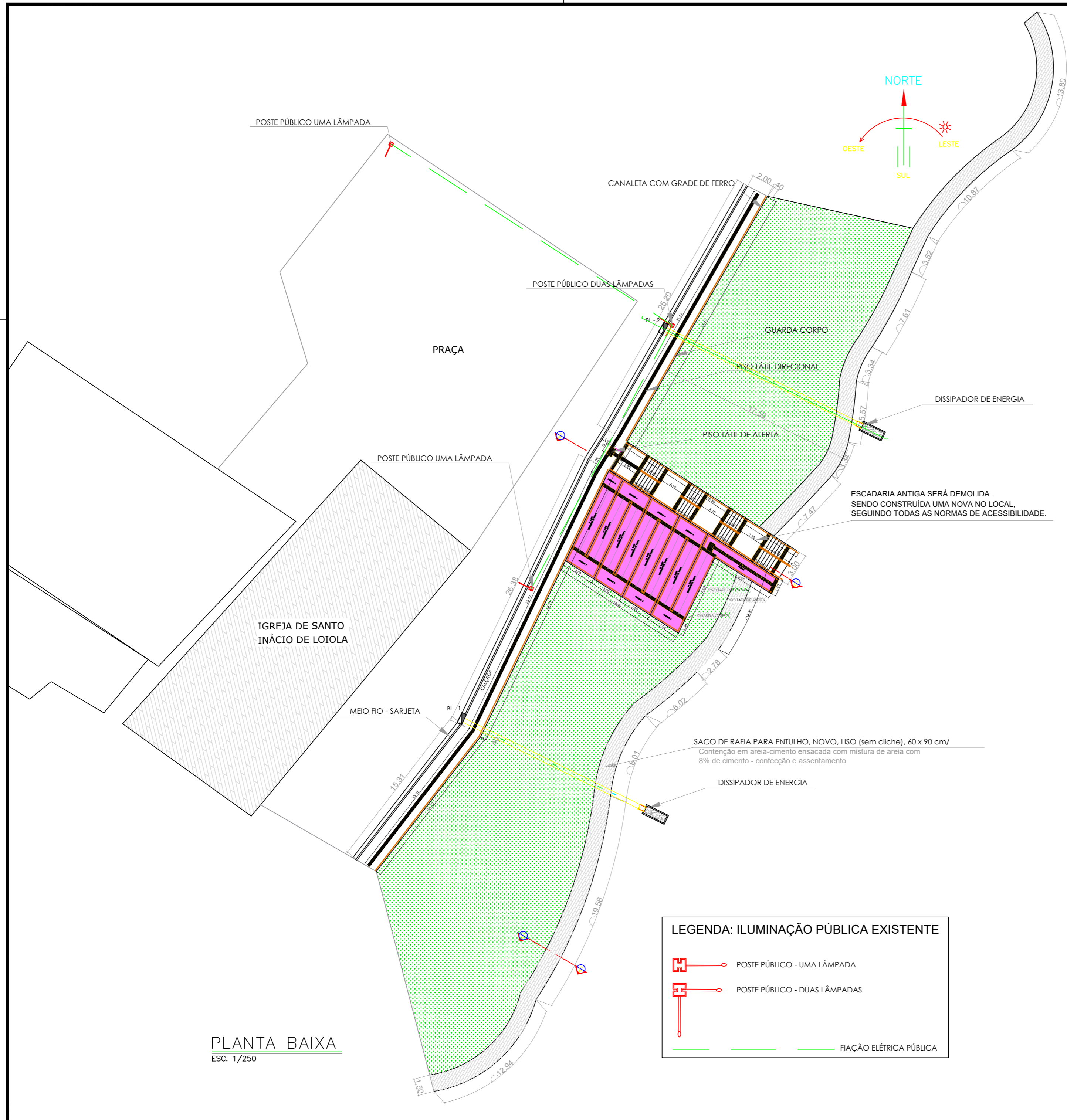
PLANTA BAIXA ESC. 1/250