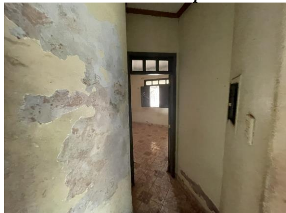
Fotos 11 e 12- Vista interna de quarto e paredes com reboco com defeito.

Fabio Andrey Souza Melo Eng° Civil – CREA 28.961 D-PA Núcleo de Engenharia da SEMED