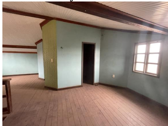
Fotos 09 e 10- Vista do forro desabado e vista do andar superior.