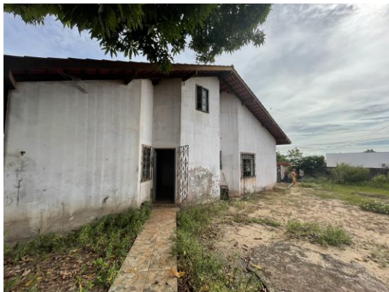
Fotos 01 e 02- Vista frontal e lateral da residência.