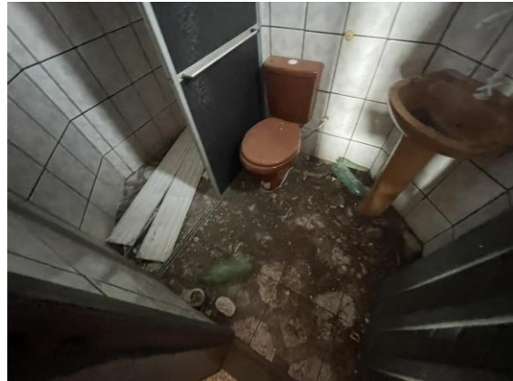
Fotos 07 e 08- Vista interna da suíte e vista do forro desabado.