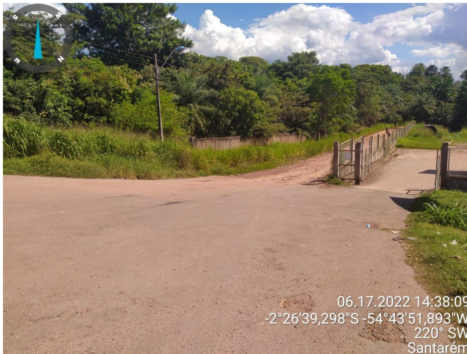
Figura 5 - Duplicação da rodovia Cuiabá (-2°26'39,301"S _ -54°43'51,888"W)