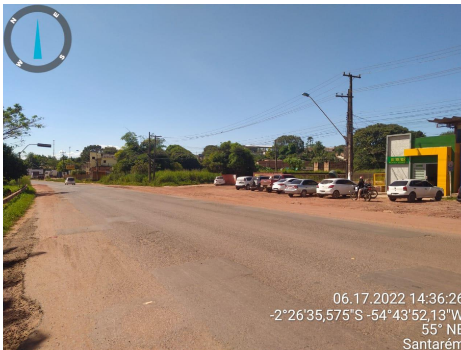
Figura 15 - Duplicação da rodovia Cuiabá (-2°26'35,56''S _ -54°43'52,117''W)