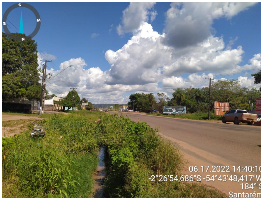
Figura 9 - Duplicação da rodovia Cuiabá (-2°26'54,683''S _ -54°43'48,431''W)