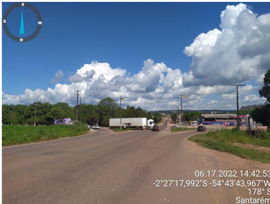
Figura 13 - Duplicação da rodovia Cuiabá (-2°28'0,104''S _ -54°43'41,026''W)