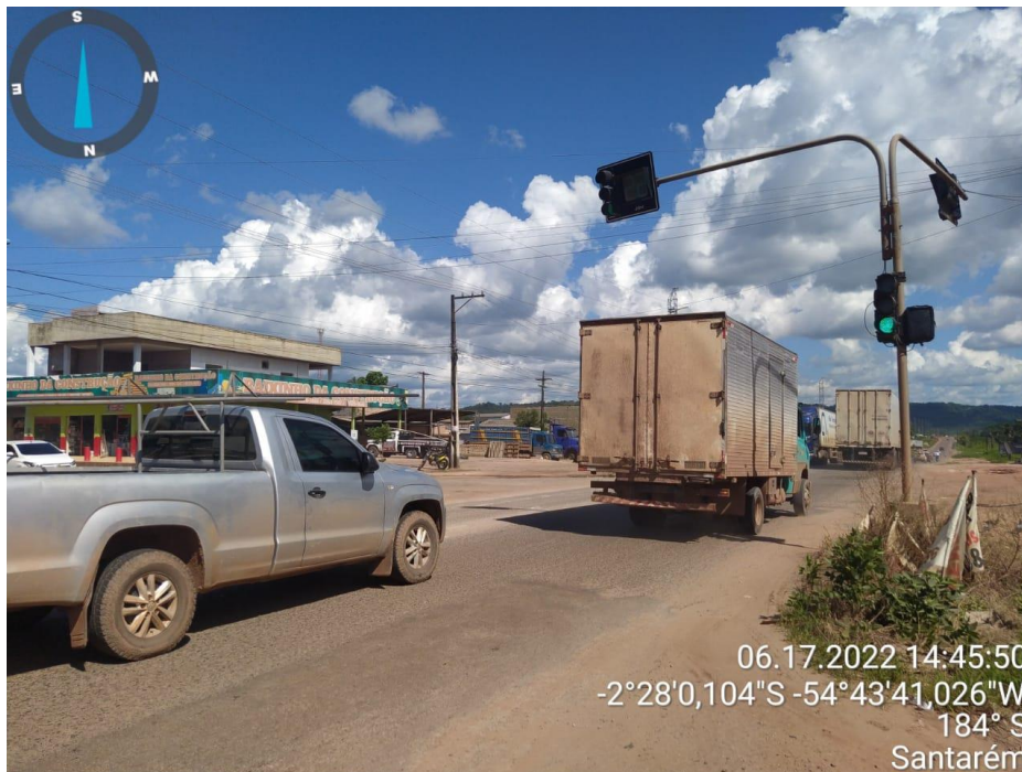
Figura 11 - Duplicação da rodovia Cuiabá (-2°28'0,104''S _ -54°43'41,026''W)