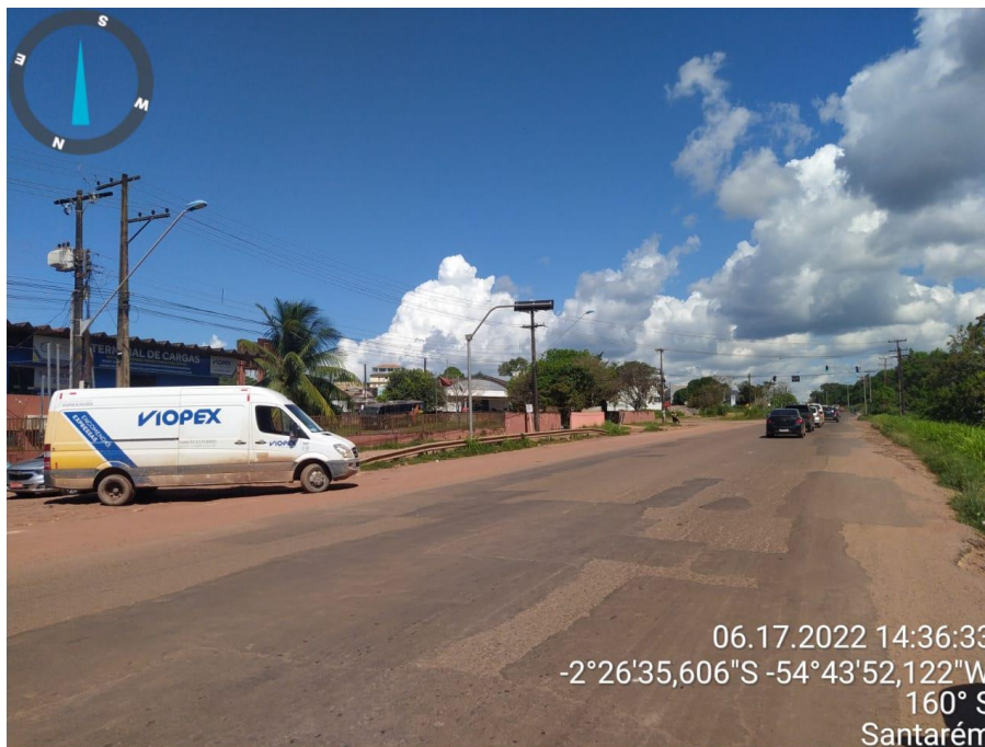
Figura 7 - Duplicação da rodovia Cuiabá (-2°26'54,744''S _ -54°43'48,679''W)