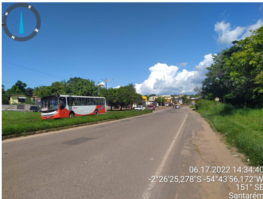
Figura 3 - Duplicação da rodovia Cuiabá (-2°26'35,607''S _ -54°43'52,103''W)