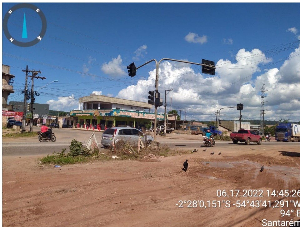
Figura 16 - Duplicação da rodovia Cuiabá (-2°28'0,151"S _ -54°43'41,291"W)

Av. Barão do Rio Branco, S/N – Aeroporto Velho – CEP: 68005-310 – Santarém/Pará E-mail: gabinete.seminfra@santarem.pa.gov.br