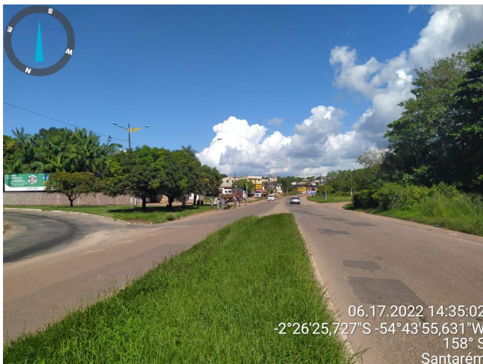
Figura 1 - Duplicação da rodovia Cuiabá (-2°26'25,727"S _ -54°43'55,631"W)